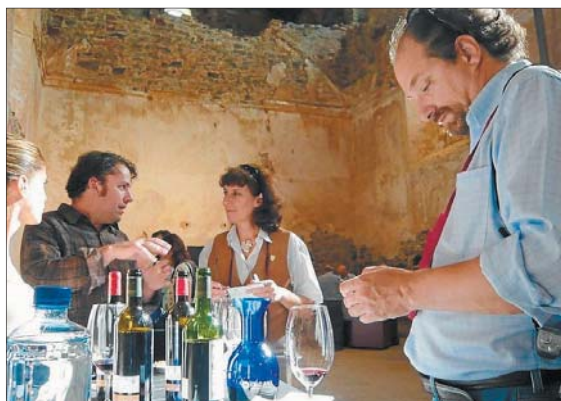
Restauradors d'arreu del món ja coneixen les virtuts dels vins de la DO Qualificada Priorat. Ara toca el reconeixement dels de casa.

Així mateix, es vol reconèixer i promocionar aquells establiments de restauració que tenen en la seva carta de vins un alt percentatge de vins catalans amb DO i amb especial incidència dels