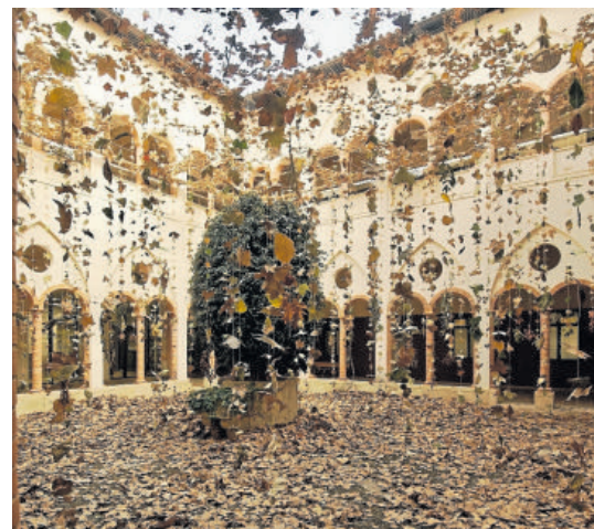
La instal·lació 'Ritmes de la terra' ha estat premiada amb el Premi del Jurat i el Premi dels Xiquets.

Finalment, el Premi del Públic va ser per a la instal·lació Batec , ubicada al Pati del Convent de la Puríssima Concepció Victòria i dissenyada des de l'Escola d'Art i Disseny d'Amposta. Una proposta en la qual «esquemàtizava el funcionament del cor humà a l'interior del pati. Quatre esferes unides, de diferents mides, s'il·luminen reproduint el trànsit de la sang pel seu interior. Primer les aurícules i després els ventricles, amb uns segons de diferència. A l'exterior de l'edifici, al carrer Montcada, surt una llum vermella intermitent acompanyada pel so d'uns batecs. Tot això atreu l'atenció dels vianants, activant la curiositat que els portarà a descobrir aquest espai».